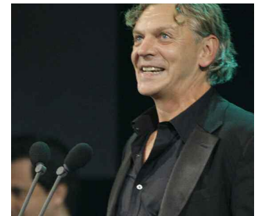
La soirée des Gémeaux a bien «scoré» cette année.