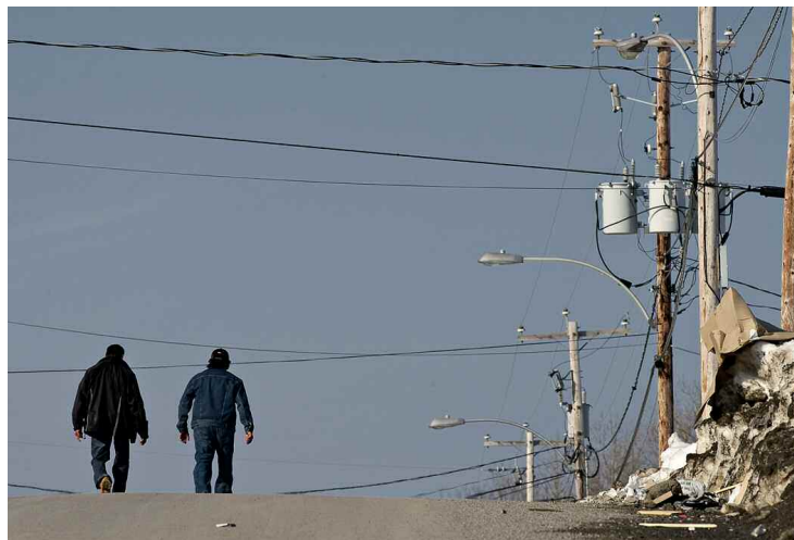
Le nombre de cas de signalements à la DPJ dans le Nord québécois est alarmant.

Source : Nunavik; Rapport de suivi des recommandations de l'enquête portant sur les services de protection de la jeunesse dans la baie d'Ungava et la baie d'Hudson, Commission des droits de la personne et des droits de la jeunesse, juin 2010