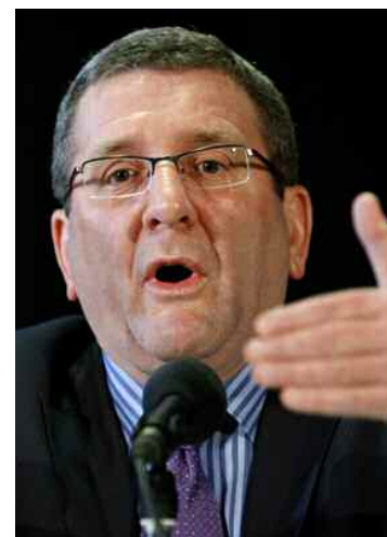
Le maire Régis Labeaume était d'une humeur massacrante lundi en annonçant la fin de la collaboration entre sa ville et le controversé Clotaire Rapaille.