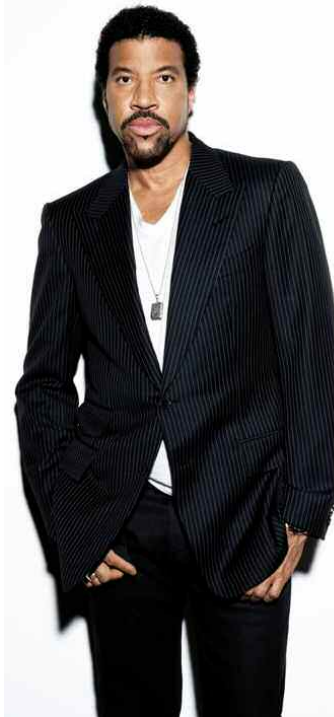
Lionel Richie fera le spectacle d'ouverture avec Cassandra Wilson.