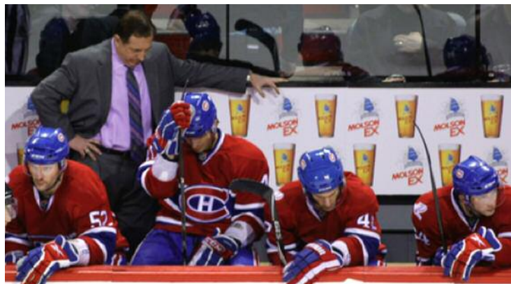
Les décisions de Jacques Martin font des malheureux chez le Canadien, surtout parmi les joueurs francophones.

Pominville une première fois au repêchage, le Canadien n'a même pas daigné le réclamer lorsqu'il était disponible au ballottage il y a cinq ans. Pominville n'aurait rien coûté en joueur, tout comme Alex Burrows qu'un éclaircissement de l'organisation des Canucks de Vancouver a découvert dans le Sud profond des États-Unis.