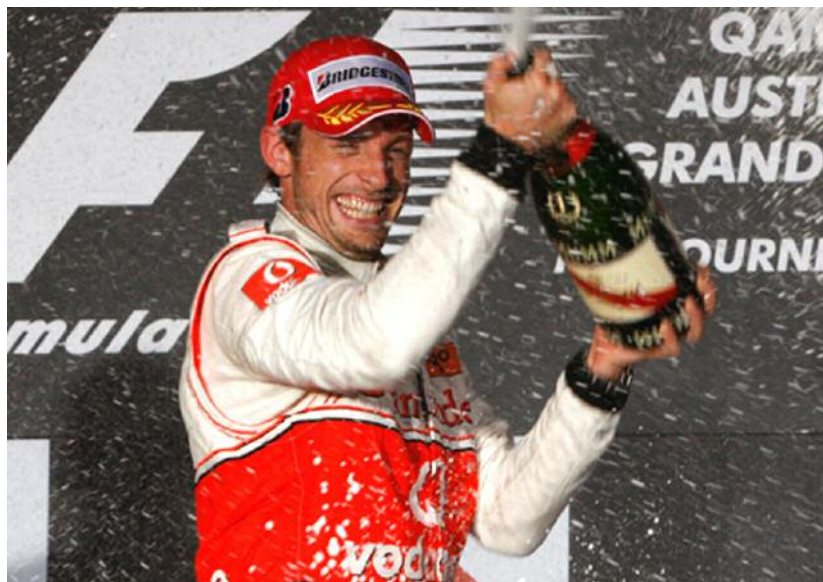
Le Britannique Jenson Button a défendu avec succès la victoire qu'il avait remportée l'an dernier au Grand Prix d'Australie.