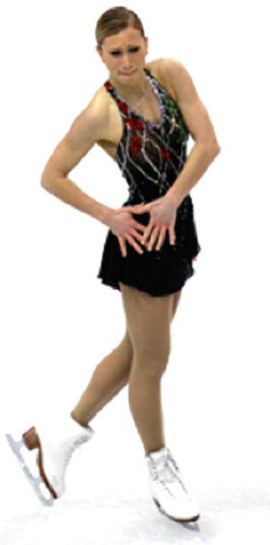
Joannie Rochette est surexposée depuis son retour des Jeux, selon un agent d'athlètes.

Selon mes sources, on lui a versé une somme de 20 000 $ afin qu'on