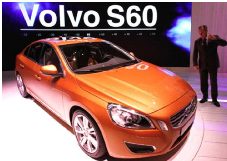
L'avenir de Volvo passe notamment par l'arrivée de la toute nouvelle S60, dévoilée en première mondiale au récent Salon de Genève.

La direction de Geely fera un dernier examen des finances de sa nouvelle propriété et se réserve le