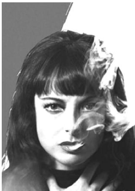
Pascale Bussières incarne avec brio la sensibilité, le cynisme et les frustrations d'Inès.