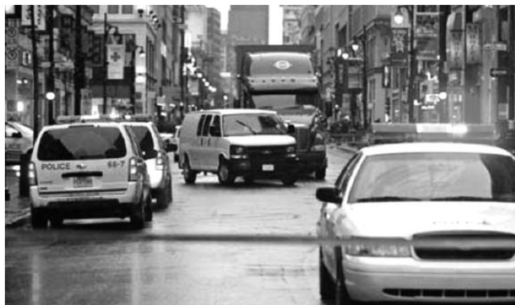
La rue Sainte-Catherine a été fermée, et le char est demeuré sur place pour fins d'enquête.

Selon les premiers éléments d'enquête de la police, le jeune ne faisait