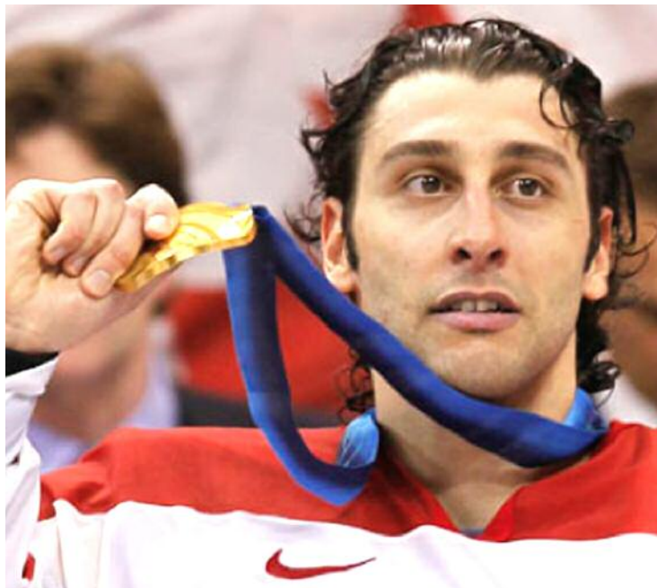
Roberto Luongo a fait taire ses dénigreur en contribuant à la conquête de la médaille d'or.

Luongo savait que les siens n'auraient pas la vie facile, lui qui a effectué 34 arrêts dans le match.