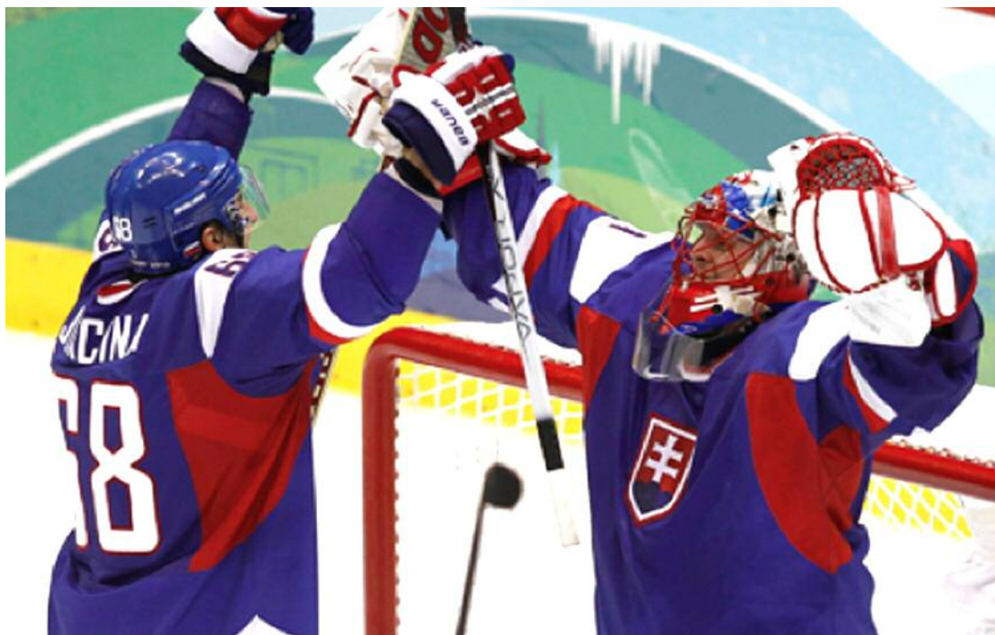
Jaroslav Halak et ses coéquipiers ont fait la fierté de leurs compatriotes durant les deux semaines du tournoi olympique.

La Slovaquie ne compte de 8671 hockeyeurs et seulement 17 d'entre eux évoluent dans la LNH. Et bien, ces négligés finis (qui jouaient au beau milieu de la nuit en Europe) ont rempli tous les bars de leur pays et privé leurs compa-