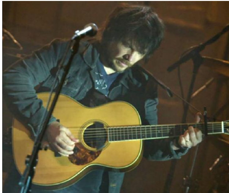
Jeff Tweedy, figure de proue de Wilco, s'est découvert une belle complicité avec la foule de L'Olympia.

I am Trying To Break Your Heart était dotée d'une richesse d'arrangements qui ramenait aux Beach Boys, période Pet Sounds ; Impossible Germany fut émaillée d'un solo aussi pénétrant qu'incisif de Cline qui triturait ses cordes métalliques comme pas un; alors que Bull Black Nova était pimpante en raison des claviers de Jorgensen, le tout, se terminant en jam collectif. Comme Radiohead, Wilco ne s'impose pas de barrières sur scène.