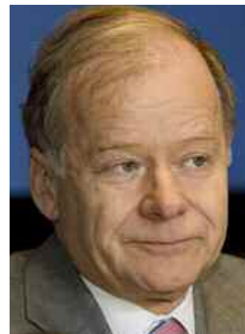
Le ministre des Finances, Raymond Bachand s'inquiète du projet d'Ottawa.

Déjà, le gouvernement Charest a porté en Cour d'appel ce dossier «majeur et prioritaire», qui risque de se retrouver devant la Cour suprême, ultimement.