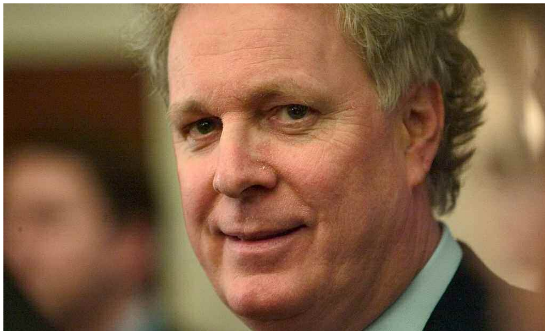
Le premier ministre Jean Charest a contribué pour 5000 $ à la fondation de l'homme d'affaires Joe Borsellino.

Avec l'étroite collaboration de Fabrice de Pierrebouurg