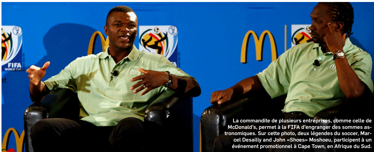
La commandite de plusieurs entreprises, comme celle de McDonald's, permet à la FIFA d'engranger des sommes astronomiques. Sur cette photo, deux légendes du soccer, Marcel Desailly and John «Shoes» Moshoeu, participent à un événement promotionnel à Cape Town, en Afrique du Sud.