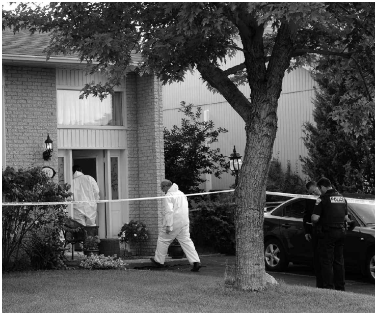
Le fils de la victime a été interrogé par les enquêteurs.

Bouleversé par les événements, un ami du suspect a été impliqué dans un accident de voiture tout près des lieux du meurtre lundi après-midi, lorsqu'il a démarré en trombe après avoir appris ce qui s'était passé. Il a été arrêté par les policiers et sera vraisemblablement accusé de conduite dangereuse.