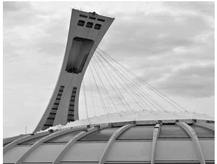
Le stade olympique sera doté d'un nouveau toit.

Les candidats potentiellement intéressés par le projet ont jusqu'au 27 août 2010 pour déposer un dossier de candidature.