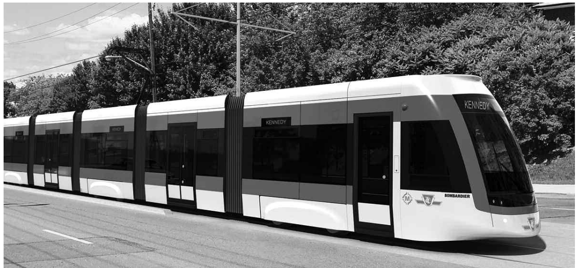
L'assemblage des tramways se fera à Thunder Bay, en Ontario.

«Bombardier est fier de jouer un rôle dans cette initiative très importante visant l'expansion du transport collectif à Toronto, et elle est très reconnaissante envers Metrolinx de la confiance que celle-ci lui accorde», a dit Raymond Bachant, président de Bombardier Transport, Amérique du Nord.