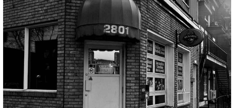
Par souci de sécurité, la Régie des alcools n'accordera aucun permis au 2801 de la rue Ontario Est.

Le bar servait aussi d'endroit de rencontre afin de distribuer les pro-