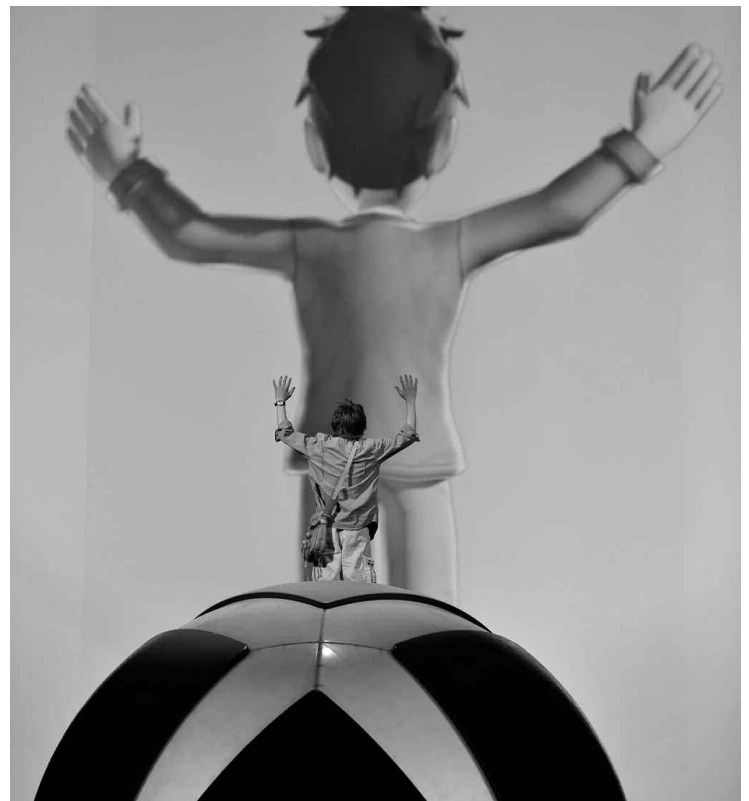
Microsoft s'est associé au Cirque du Soleil pour présenter sa nouvelle technologie Kinect.

Sans trop de surprise, on a aussi présenté une série de suites à des franchises très populaires. Halo: Reach verra le jour en septembre, Fable III le 26 octobre, Call of Duty: Black Ops le 9 novembre et Gears of War 3 quelque part en 2011. On a aussi présenté quelques images du premier jeu de la franchise Metal Gear Solid (Rising) à être lancé sur Xbox, mais aucune date officielle ne l'accompagnait.