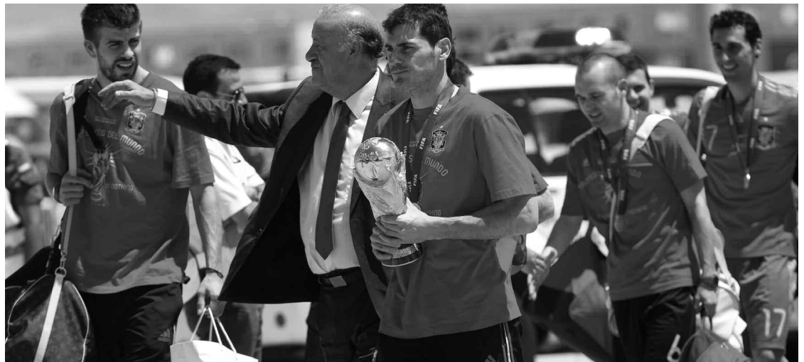
L'entraîneur de l'équipe espagnole, Vicente del Bosque, et ses joueurs, dont le capitaine Iker Casillas, tenant le précieux trophée, ont fait une rentrée triomphale à Madrid lundi.

La rencontre sera disputée dans un stade temporaire érigé sur le site de l'ancien Empire Stadium, le BC Place étant en rénovations. C'est peut-être le changement de décor dont les Alouettes ont besoin pour enfin savourer la victoire à Vancouver!