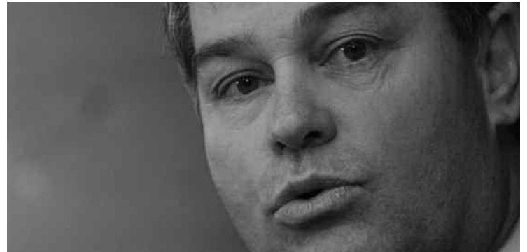
Le ministre de la Santé, Yves Bolduc, va annoncer la gratuité des traitements de procréation assistée pour les couples infertiles.

Ces coûts s'expliquent principalement par le fait que porter plusieurs fœtus en même temps augmente fortement les chances de naissances prématurées et de bébés à faible poids. Les traitements d'infertilité seraient à l'origine de 30 à 50 % des naissances de jumeaux et de près de 80 % des naissances de triplets. En 2009, le Québec a enregistré 88 600 naissances, dont 2 747 naissances multiples.