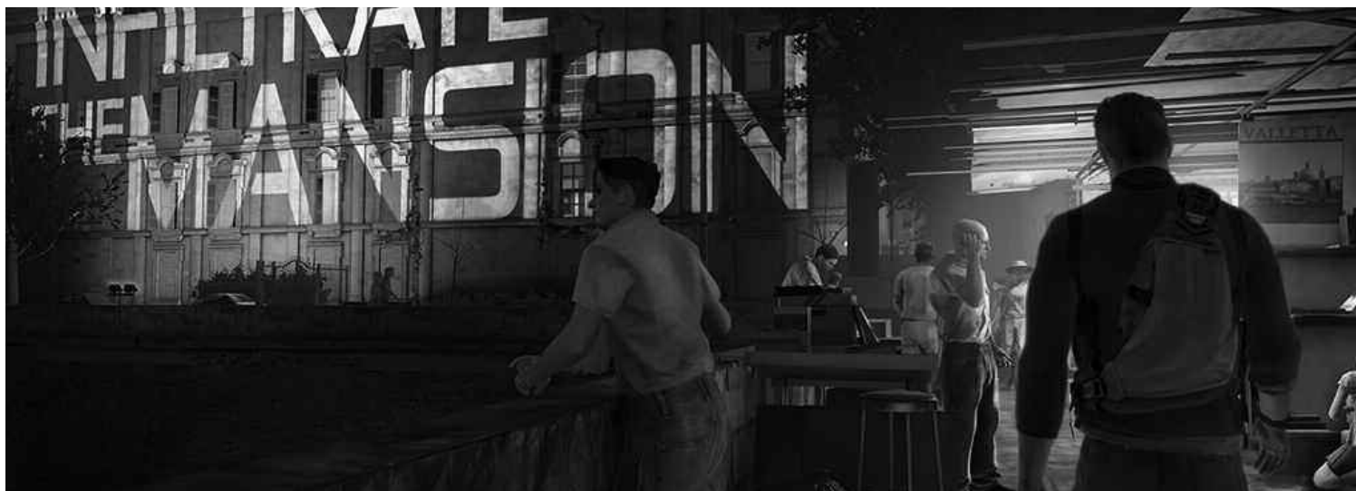
Ubisoft se réjouit du succès du jeu vidéo Splinter Cell: Conviction, vendu à environ 1,9 million d'exemplaires.