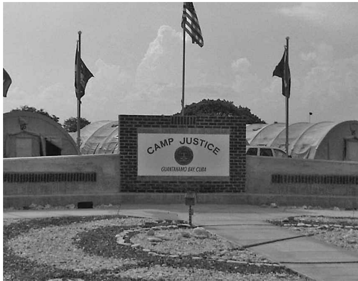
Le centre de détention de Guantanamo.

Selon lui, on lui proposait en retour une peine de 30 ans dont il n'aurait que cinq ans à purger à Guantanamo et un nombre inconnu d'années à purger au Canada. Les détails de l'entente n'ont jamais été finalisés. «J'ai demandé pourquoi alors les 30 ans, et on m'a répondu que c'était pour faire bien paraître le gouverne-