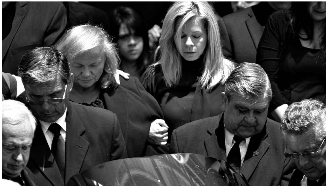
Les proches du défunt ont accompagné le cercueil à la sortie de l'église.

Sur le coup de 11 h, le cortège formé d'une dizaine de limousines noires, dont plusieurs allongées, s'est arrêté devant l'église. Les deux véhicules de tête transportaient