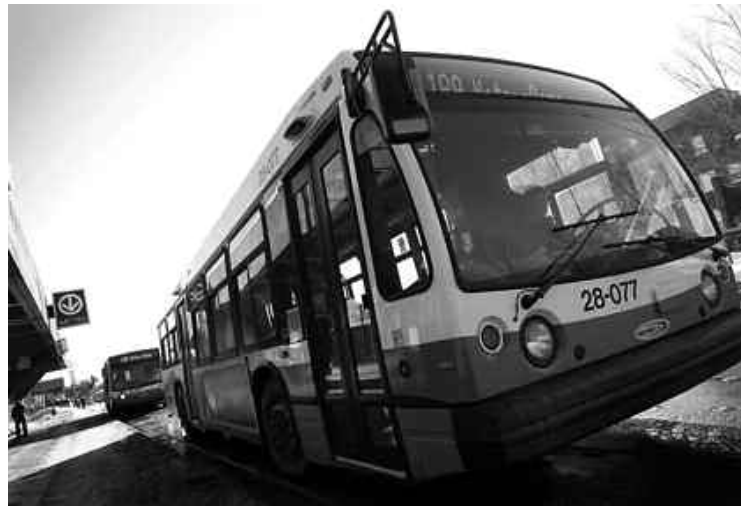
L'utilisation des transports en commun a augmenté au cours des cinq dernières années dans la région de Montréal.

La voiture a aussi été délaissée dans une proportion moindre sur la Rive-Sud et à Laval, où les déplace-