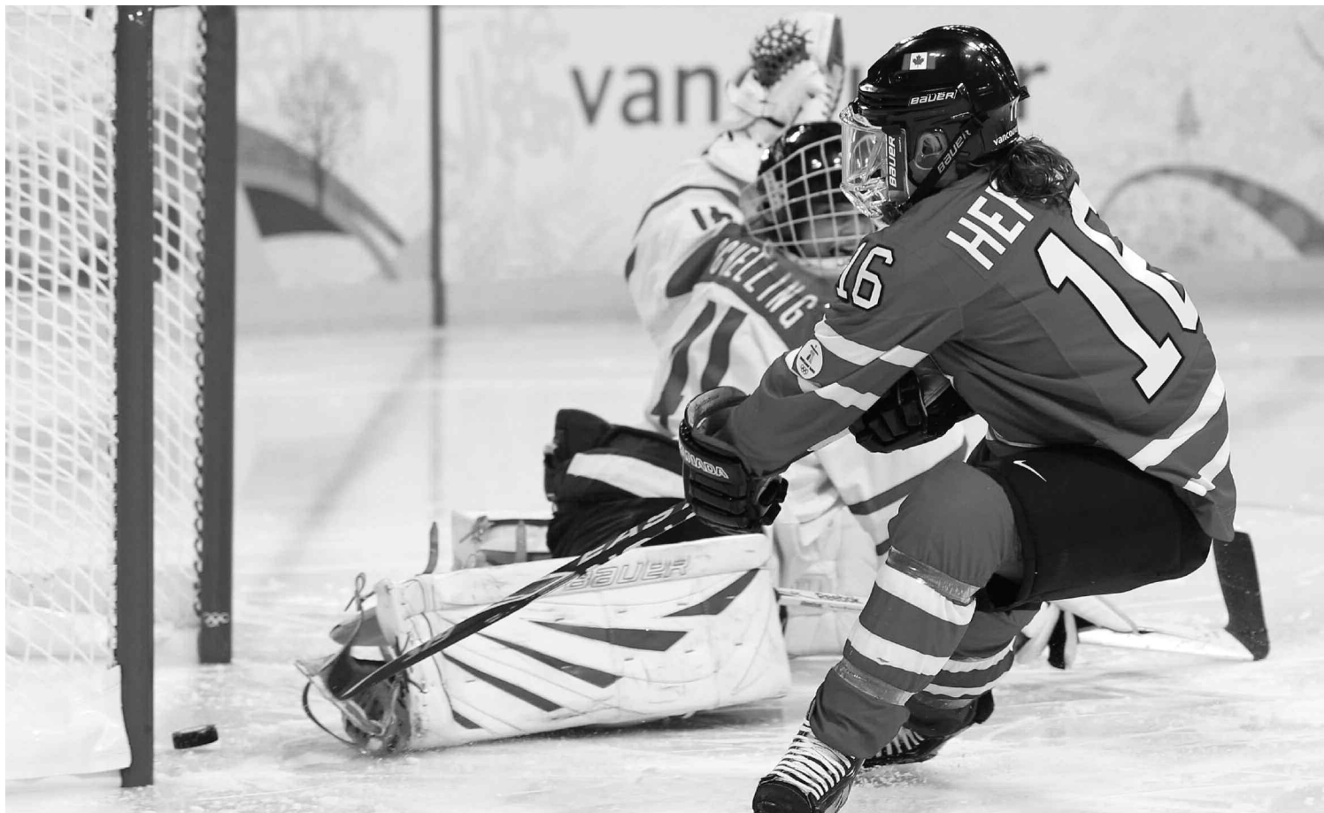
La Canadienne Jayna Hefford a déjoué la gardienne suisse Florence Schelling au terme d'une échappée.