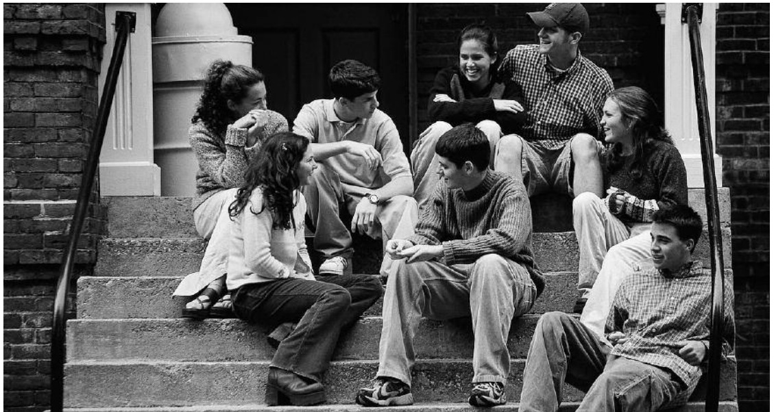
Les jeunes Québécois continuent d'exceller en lecture, en sciences et en mathématiques, révèle une étude internationale.

Dans une lettre envoyée aux médias jeudi et intitulée «Soyons fiers de notre système d'éducation!», 17 universitaires en provenance de Montréal, de Sherbrooke, de Trois-Rivières, de Rimouski, de l'Ouataouais et de l'Abitibi tiennent à mettre en lumière l'excellence du système d'éducation québécois.