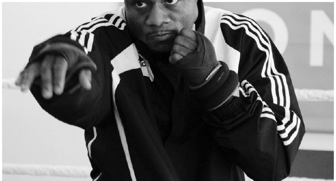
Jean Pascal est considéré comme l'un des meilleurs, sinon le meilleur, boxeurs de la planète chez les mi-lourds.