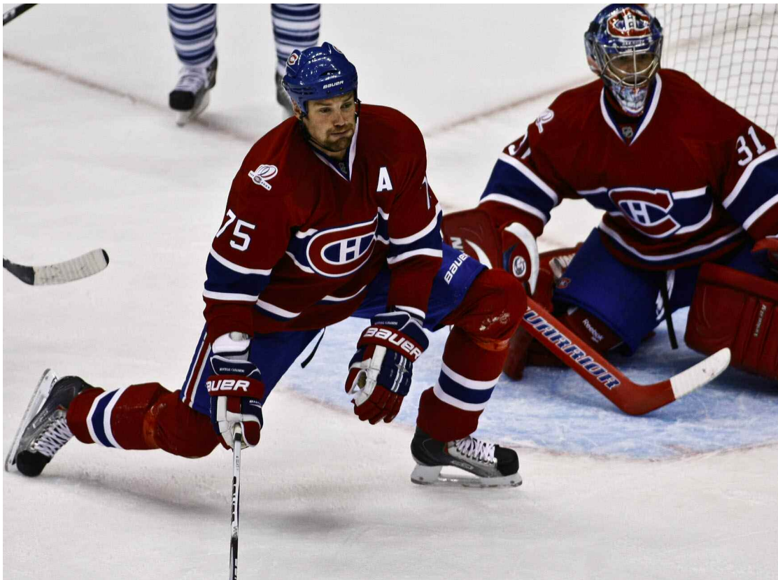
Carey Price n'est pas le deuxième gardien du Canadien... C'est à Hal Gill que ce titre revient.