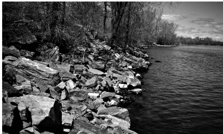
C'est en bordure du fleuve que la mère aurait failli noyer sa fille.

« Les plus petits (à partir de cinq ou six ans, précisera-t-elle plus tard) recevaient des coups de ceinture, de règle ou de guenille mouillée, ce qui fait moins mal. Les plus vieux, c'était des coups de bâton de hockey, de balai et de chaussure. Ça faisait tout le temps mal. Il y