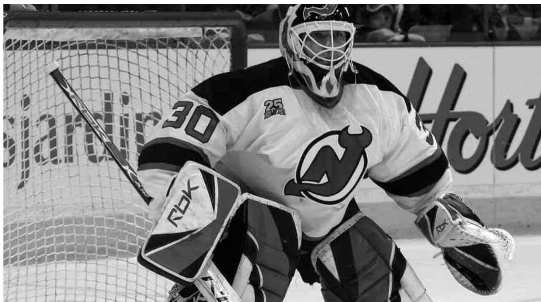
Martin Brodeur est en quête de la 100e victoire de sa carrière en séries éliminatoires. Atteindra-t-il ce plateau mardi soir face aux Flyers?

Il sera en compétition avec Ryan Miller et Ilya Brizgalov. Le gardien américain des Sabres de Buffalo, qui est maintenant considéré comme le dauphin de Brodeur, a empoché 41 triomphes en 69 sorties avec une moyenne de 2,22 et un pourcentage d'arrêt, menant son club au titre de sa division. Quant au gardien russe qui a mis 42 gains en banque en 69 rencontres avec une moyenne de