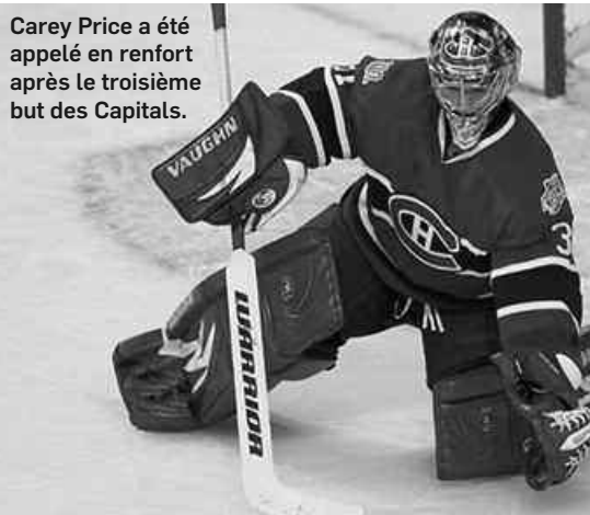
Carey Price a été appelé en renfort après le troisième but des Capitals.

Quatre buts accordés sur seulement 10 tirs, ce n'est pas comme ça qu'une équipe peut espérer, peu importe que les adversaires soient les Capitals ou les Maple