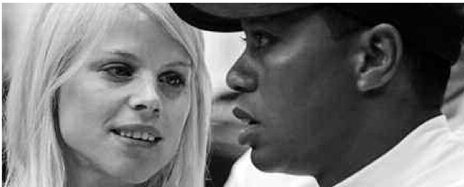
Elin Nordegren et Tiger Woods ne forment plus un couple.