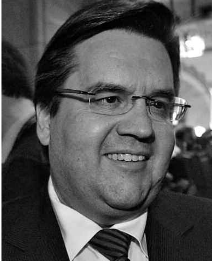
«Un scab, par définition, ça me pue au nez», a dit Denis Coderre.

La loi actuelle, vieille de trois décennies, a été créée avant l'avènement d'Internet. La loi ouvre la porte à l'utilisation de briseurs de grève (ou de lock-out) qui travaillent à distance, par Internet, sans avoir à franchir de piquets de grève. C'est ce que cherchent à corriger les jeunes libéraux du Québec