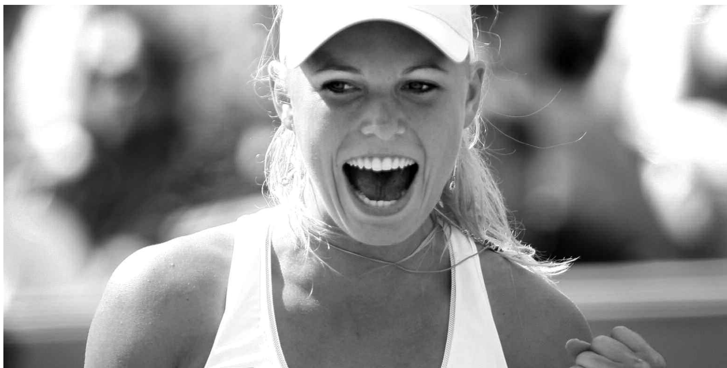
Caroline Wozniacki n'a pas été inquiétée lors de la finale de la coupe Rogers qu'elle a remportée en deux manches de 6-3 et 6-2 face à Vera Zvonareva.

Ce fut une autre ovation instantanée pour la championne.