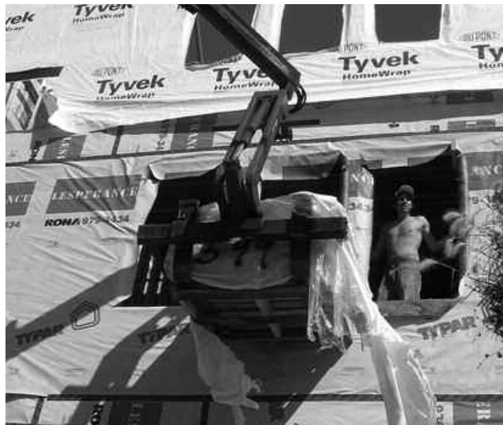
C'est encore l'impasse dans les négociations dans le secteur de la construction.

L'Alliance syndicale regroupe le Conseil provincial (International) des métiers de la construction, la CSD-Construction, la CSN-Construction, le Syndicat québécois de la construction et la FTQ-Construction. Ce groupe représente les 146 000 travailleurs de quatre secteurs de la construction : institutionnel; commercial/industriel; le génie civil/voirerie; et résidentiel. Les négociations avec l'ACQ et les 15 000 entreprises qu'elle représente touchent uniquement les trois premiers secteurs, mais une entente de principe est intervenue en juin dans le secteur du génie civil et de la voirie.