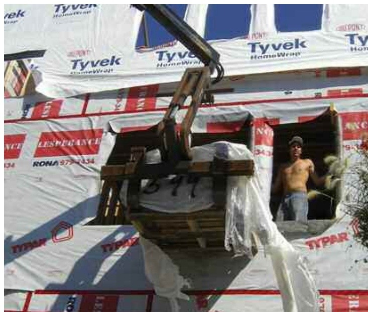
C'est encore l'impasse dans les négociations dans le secteur de la construction.

L'Alliance syndicale regroupe le Conseil provincial (International) des métiers de la construction, la CSD-Construction, la CSN-Construction, le Syndicat québécois de la construction et la FTQ-Construction. Ce groupe représente les 146 000 travailleurs de quatre secteurs de la construction : institutionnel; commercial/industriel; le génie civil/voirier; et résidentiel. Les négociations avec l'ACQ et les 15 000 entreprises qu'elle représente touchent uniquement les trois premiers secteurs, mais une entente de principe est intervenue en juin dans le secteur du génie civil et de la voirie.