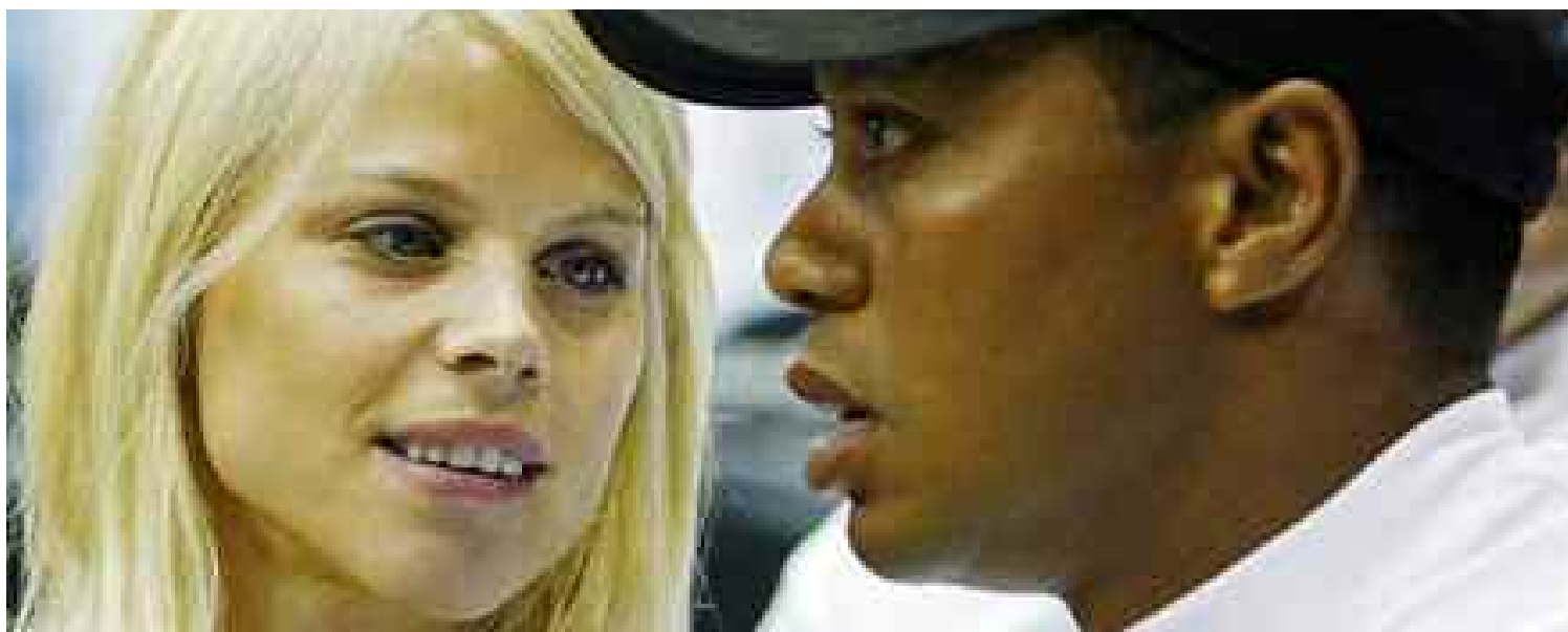
Elin Nordegren et Tiger Woods ne forment plus un couple.