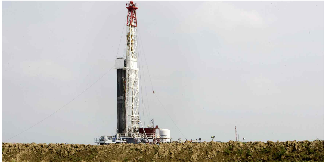
La Fédération québécoise des municipalités est profondément inquiète de la tournure que prend l'exploitation des gaz de schiste.

«Tous les signes indiquent que le gouvernement désire aller de l'avant avec cette nouvelle filière, mais lorsque nous nous rendons sur le terrain, comme j'ai eu l'occasion de le faire dans le cadre des rendez-vous du président de la FQM, nous constatons de réelles inquiétudes de la part des municipalités et des populations concernées, indique le président de la