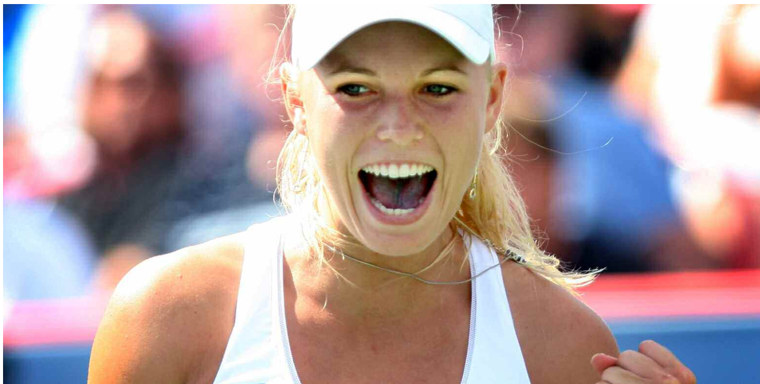
Caroline Wozniacki n'a pas été inquiétée lors de la finale de la coupe Rogers qu'elle a remportée en deux manches de 6-3 et 6-2 face à Vera Zvonareva.

Ce fut une autre ovation instantanée pour la championne.