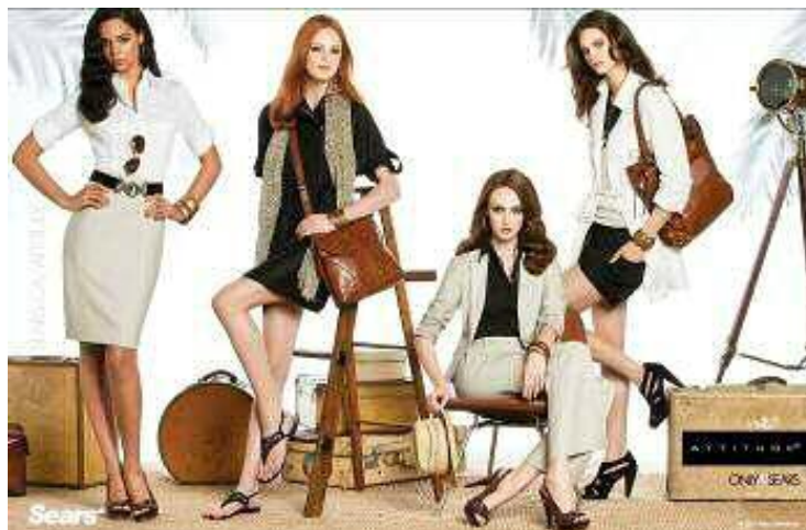
C'est au rayon des vêtements que la stratégie sera déployée, avec l'arrivée de marques plus branchées.

Au premier semestre, les revenus s'élevaient à 2,28 milliards, en recul de 3,6 %. Les ventes des magasins comparables ont glissé de 2,2 %. Et les profits ont chuté de 34 %, passant de 59,4 M$ l'an dernier à 39,1 M$ cette année.