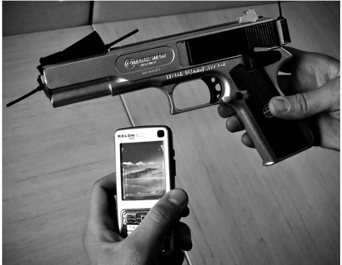
Les policiers ont aussi saisi un pistolet de forme plus traditionnelle.

En plus des deux appareils émettant des décharges électriques, les autorités ont trouvé d'autres armes dans le véhicule des suspects, notamment un fusil à air comprimé.