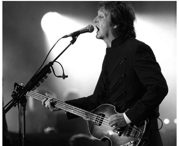
Paul McCartney est, plus que jamais, l'ultime Beatle.

Paul McCartney au Centre Bell, le jeudi 12 août.