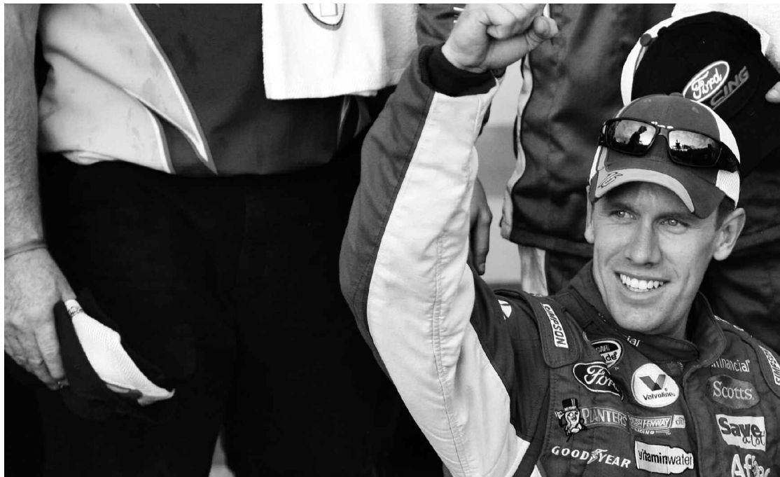
Carl Edwards défendra son titre de champion du Napa 200 à Montréal à la fin d'août.

réal sera présentée, il ne restera que deux manches (Atlanta et Richmond) à disputer avant le début de l'après-saison, communément appelé The Chase for the Sprint Cup.